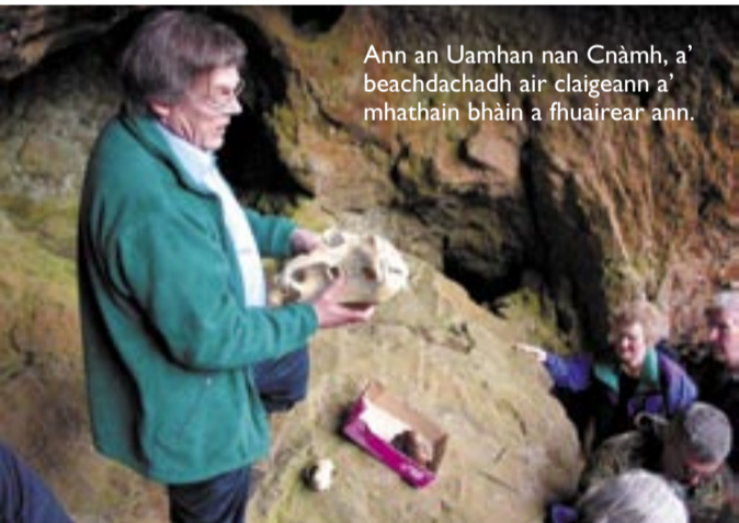
Ann an Uamhan nan Cnàmh, a' beachdachadh air claigeann a' mhathain bhàin a fhuair ann.

From 'A Man in Assynt' by Norman MacCaig, 1969